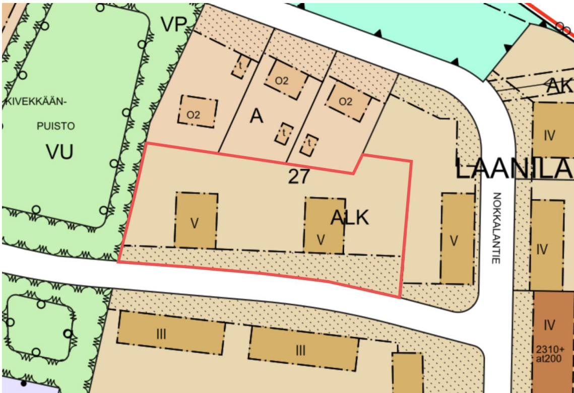
Kuva 3 Ote voimassa olevasta asemakaavakartasta vuodelta 1963. Kartalle on merkitty punaisella viivalla alue, jolla suunnitellaan asemakaavan muuttamista.